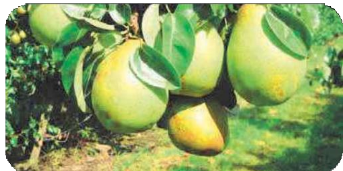
Peer Doyenné du Comice