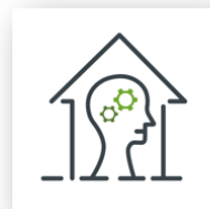
Mensgericht hybride werken

In 2021 gaan we op missie om deze pijlers ook effectief te realiseren in ons beleid, om uiteindelijk het certificaat van Baanbrekende Werkgever in november 2021 te kunnen bekomen.