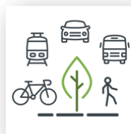
Slimmer en groener onderweg